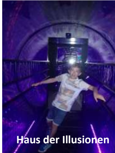
Haus der Illusionen