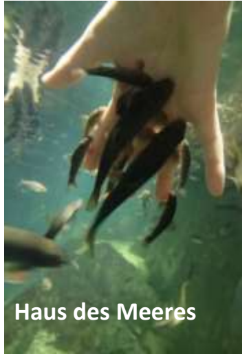
Haus des Meeres